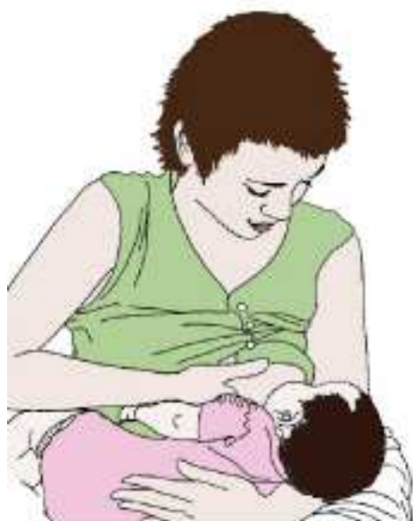
Fig. 1 Cradle Position